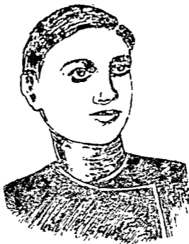
बालक गोपाल कृष्ण गोखले

सरल हृदय में सच्चाई का, बच्चो अपने दीप जलाओ। आवदार मोती जिसमें हैं, मन के उजले सीप खिलाओ।